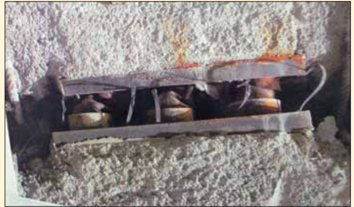
Obr. 4 Stlačené deformační prvky Fig. 4 Compressed yielding elements

získávání veškerého kameniva pro stříkaný i konstrukční beton ze sutěového kuzele těsně vlevo nad raženým portálem druhé tunelové trouby.