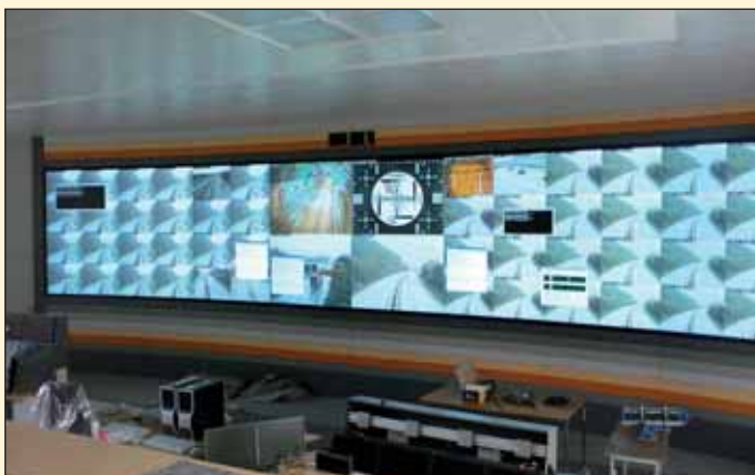
Obr. 1 Nové vybavení řídicího centra St. Michael Fig. 1 Unfinished new traffic management room

Skutečnost, že hřeben Alp podcházela dálnice dosud jen jednou tunelovou troubou s obousměrným provozem, byla spolu s nárůstem kamionové dopravy příčinou dopravních komplikací i velkého neštěstí při požáru, který v tunelu vypukl v brzkých ranních hodinách dne 29. 5. 1999. Havárii zapříčinil řidič kami-