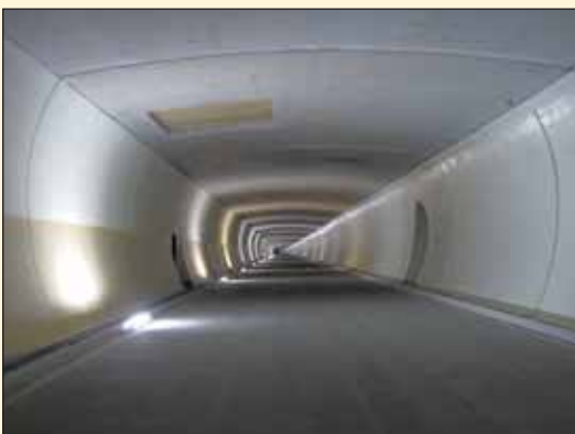
Obr. 5 Definitivní ostění a mezistrop druhé tunelové trouby Fig. 5 Final lining and intermediate deck in the second tunnel tube

Tloušťka definitivního ostění je v ražených částech navržena 30 cm a v převážné většině je provedeno jako nevyztužené. Další zajímavostí stavby je