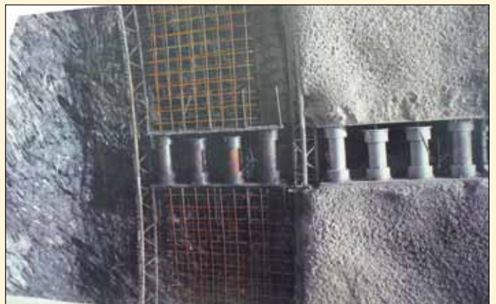
Obr. 2 Pohled na deformační elementy osazované do primárního ostění Fig. 2 View of yielding elements installed in the primary lining