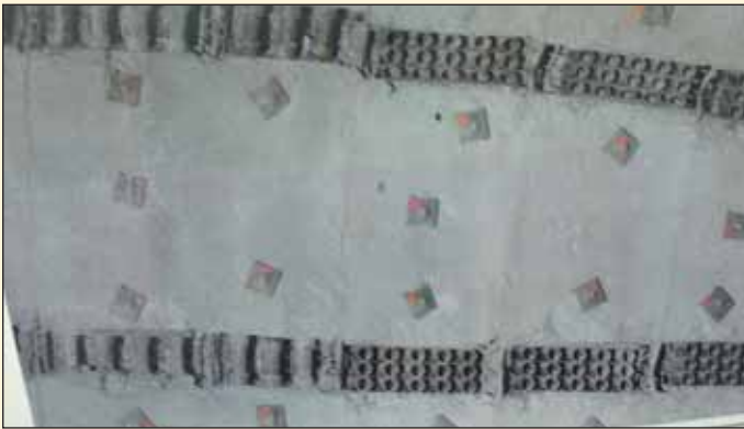
Obr. 3 Dva druhy použitých elementů Fig. 3 Two types of the elements used

provozu 4. 4. 2008, ale obousměrný provoz trval kvůli sanaci první tunelové trouby až do 30. 4. 2009. Řada dotazů na obsluhu řídicího centra samozřejmě směřovala ke zvýšení bezpečnosti provozu. Součástí výstavby druhé tunelové trouby Tauernského tunelu je i 28 tunelových propojek (3 průjezdné pro nákladní vozidla, 7 průjezdných pro záchranná vozidla a zbývajících 18 propojek je průchozích), 7 zářívů a 52 hlásek SOS a požárních hydrantů. V současné době se již rozbíhá zkušební provoz nového řídicího centra, do kterého bude napojeno všech 14 tunelů v úseku dálnice od Salcburku až po Vílach (obr. 1).