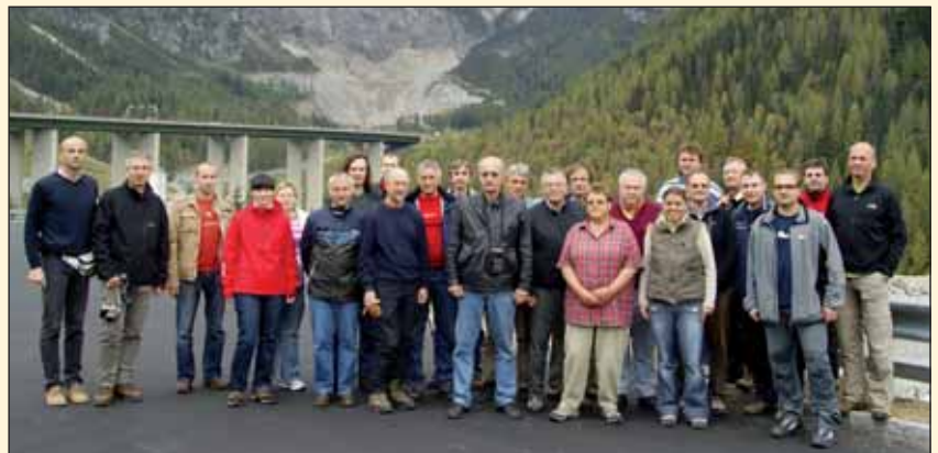
Obr. 6 Společné foto účastníků exkurze před severním portálem tunelu Fig. 6 Excursion attendees in front of the northern portal

Betonáž definitivního ostění zhotovitel dokončil v polovině letošního roku a náš průvodce se nezapomněl pochlubit, že z hlediska kvality betonů ostění patří druhá tunelová trouba ke špičce nově prováděných rakouských tunelů (obr. 5). V tunelových propojkách, které jsou vyraženy do vzdálenosti 10 m od provozované první tunelové trouby, tvoří definitivní ostění stříkaný beton.