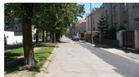
■ Původní stav