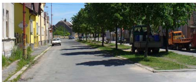
■ Prostor ulice Okružní před rekonstrukcí