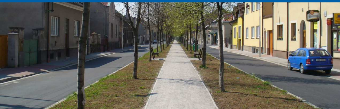
■ Okružní ulice po rekonstrukci