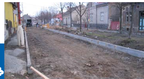
■ Okružní ulice v průběhu rekonstrukce.