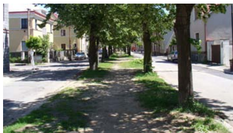
■ Původní stav