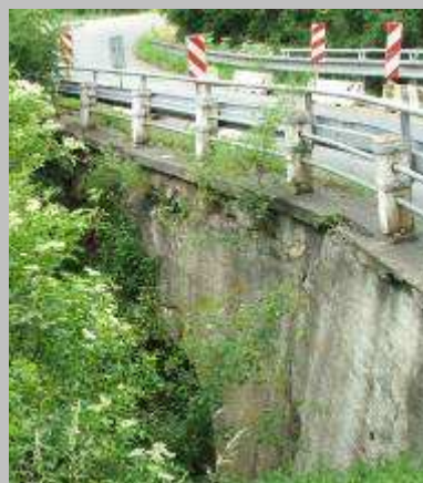
■ Poruchy stávajícího klenbového mostu