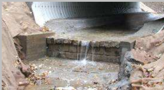
■ Úprava koryta potoka na výtoku