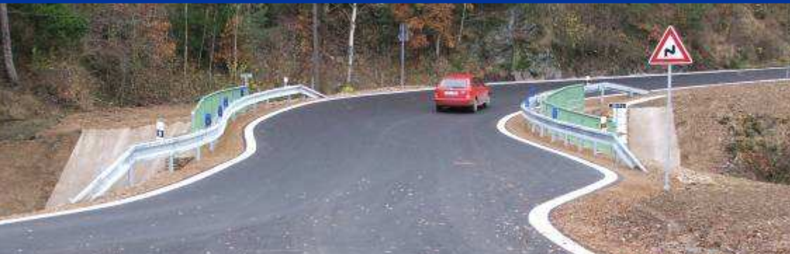
■ Most přes potok Radubice u obce Kladruby – příčné uspořádání na komunikaci s napojením křižovatky