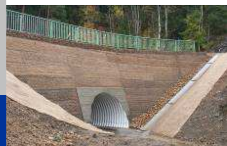
■ Pohled na vtokovou stranu