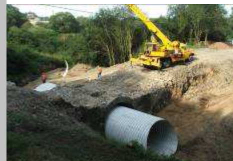
■ Vložení flexibilní ocelové konstrukce po částečném ubourání čel stávajícího mostu