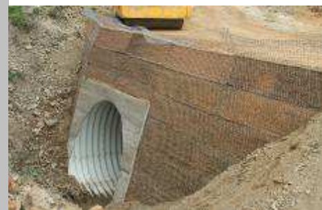
■ Svahy z vyztužených zemin