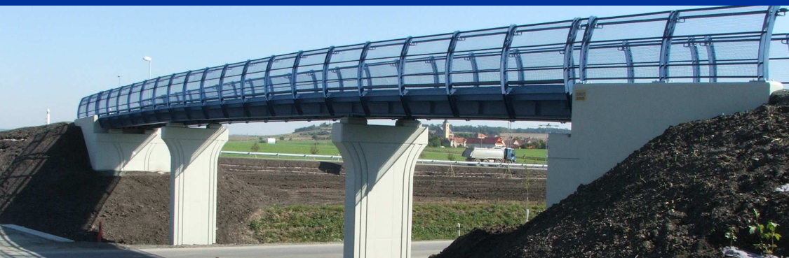
■ Lávka Ovčáry – pohled na lávku