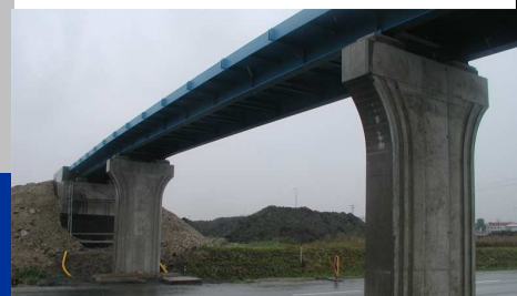
■ Lávka Ovčáry-pohled na rozestavěný objekt