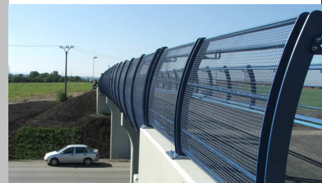
■ Lávka Ovčáry – boční pohled na zábradlí