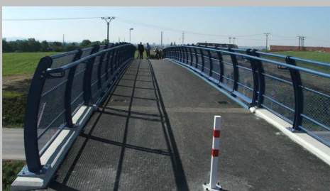
■ Lávka Ovčáry – příčné uspořádání