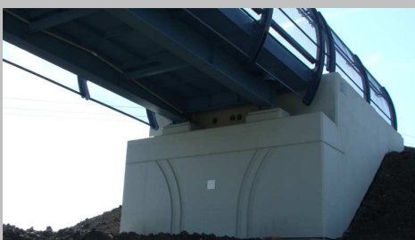
■ Lávka Ovčáry – pohled na opěru