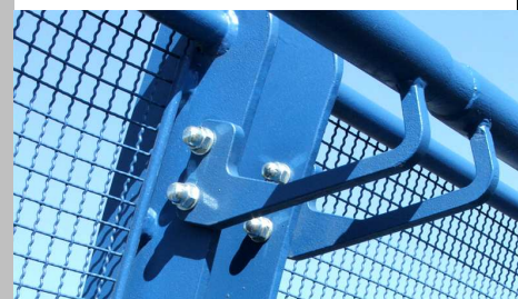
■ Lávka Ovčáry- detail upevnění madla