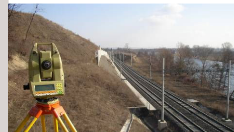
■ Tunel Mlčechovosty - zaměření pro návrh odvodnění