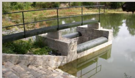
■ Revitalizace rybníků v Průhonicích - zaměření skutečného provedení