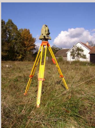
■ Vytyčování hranic pozemků