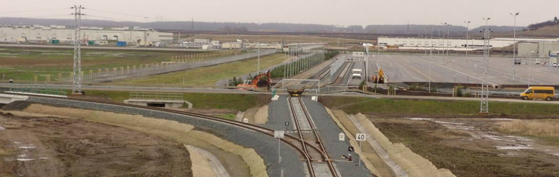
■ Průmyslová zóna Kolín-Ovčáry - výkon odpovědného geodeta města Kolína - vlečka TPCA, GEFCO

Geodetické oddělení zajišťuje soběstačnost společnosti v oblasti geodetických prací. Kancelář je vybavena měřičskými přístroji firmy Leica, špičkovým barevným scannerem firmy Contex. Projekty GIS zpracovává v systémech ArcGIS firmy ESRI nebo GeoMedia firmy Intergraph.