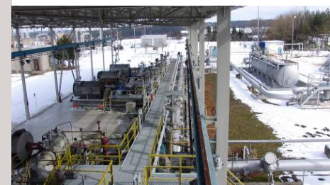
■ Ropovod Družba - čerpací stanice Velká Bíteš - zaměření původního stavu potrubí