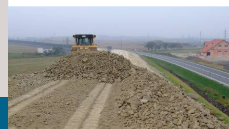
■ Průmyslová zóna Kolín-Ovčáry - zemní val - zaměření pro projekt, geometrický plán