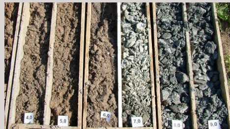
■ Detail vrtného jádra – bioethanolový závod Kolín

Jedná se především o služby pro projektovou a ostatní inženýrskou činnost firmy zahrnující i samostatné geologické zakázky.