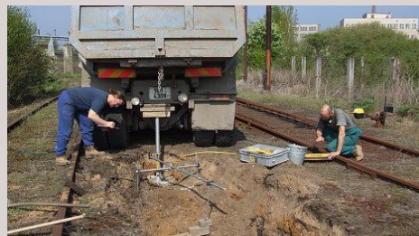
■ Geotechnický průzkum železničního spodku - Kolín

Archivní excerpci a přípravu geologických podkladů pro všechny stupně projektové činnosti, komplexní geologické průzkumy pro veškeré typy staveb, doporučení vhodnosti a technologie zakládání staveb, přejímky a prohlídky základových spár, geologickou supervizní činnost, dozorování stavebních prací, výpočty stabilit svahů a návrhy sanačních opatření, kontroly hutnění, hydrogeologické průzkumy, posouzení kvality a míry znečištění podzemních vod,