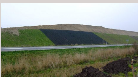
■ Projekt zemního valu vysokého 11 m - Kolín

Mezi významné realizované práce patří průzkumy a dozory během ražby tunelů a stol, inženýrsko geologické průzkumy pro silniční stavby, dozory během zemních prací na silničních stavbách, IG průzkumy pro založení pozemních staveb, návrhy a projekty zemních konstrukcí vyztužených geosyntetiky.