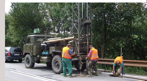
■ IG průzkum podloží silnice – Kolárovice (SK)