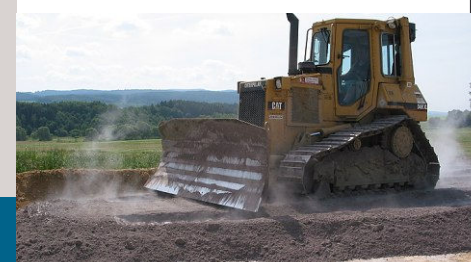
■ GT dozor během výstavby zemní konstrukce