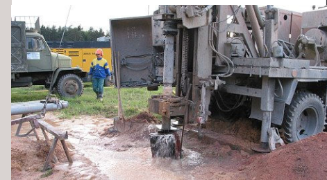
■ Hydrogeologický průzkum - Benešovice