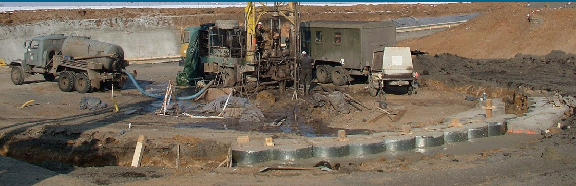
■ Inženýrskogeologický průzkum pro šachtu (nouzový východ) na tunelu Březno