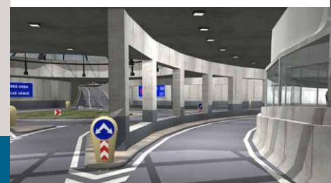
■ Č. Budějovice – přeložka silnic II/156 a II/157 podjezd pod kolejíštěm ČD