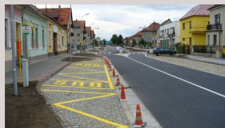
■ Vodňany – silnice II/141, Bavorovská ulice

Oddělení dále zajišťuje koordinaci a vedení projektů včetně nezbytné spolupráce s investorem, ostatními stavebními profesemi, projednání návrhů se zástupci orgánů státní správy a samosprávy, včetně vyřízení potřebných správních rozhodnutí.