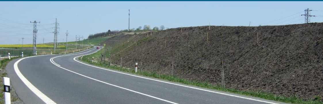
■ Průmyslová zóna Kolín – Ovcáry, protihlukový val podél silnice II/328