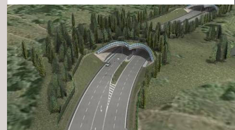
■ Č. Budějovice - přeložka silnice III/14539

U složitějších staveb pořizuje pro představení projektu na veřejnosti a v médiích digitální videoprezentace.