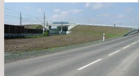
■ Starý Kolín - silniční nadjezd