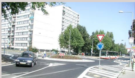
■ Kolín – křižovatka ulic Masarykova - Žižkova

V městském prostředí se jedná převážně o rekonstrukce a novostavby páteřních komunikací, návrhy dopravních skeletů nových obytných zón, řešení dopravy uvnitř komerčních areálů, návrh dopravy v klidu.